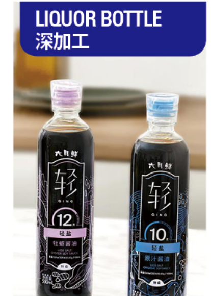
LIQUOR BOTTLE 深加工